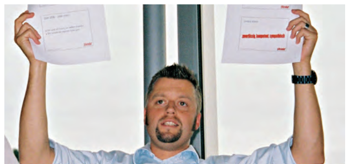
Der Coach bestimmt: So haben wir Erfolg!