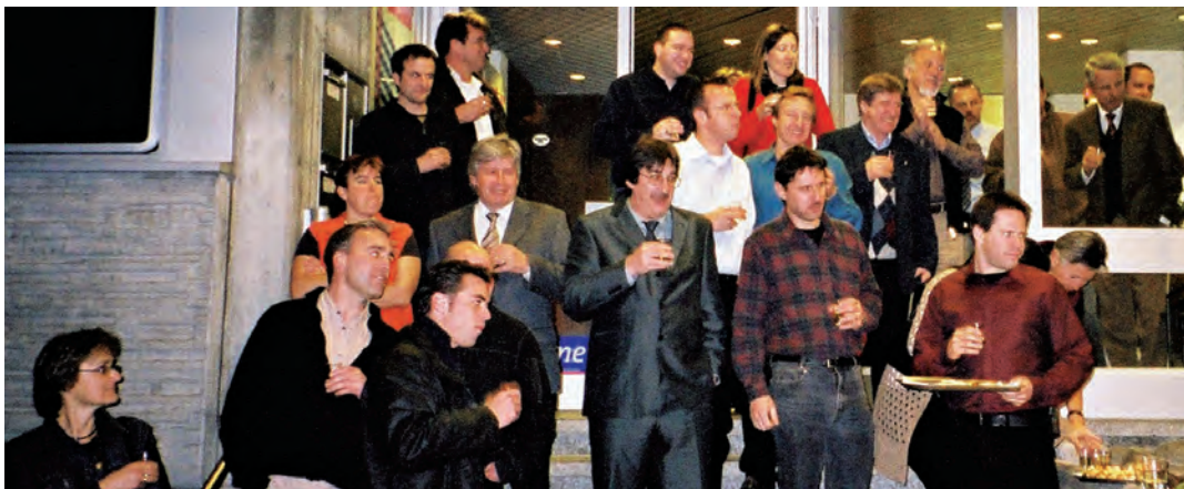
Spannung und Begeisterung der Zuschauer hätten bei der Entblätterung eines Top-Models nicht grösser sein können.