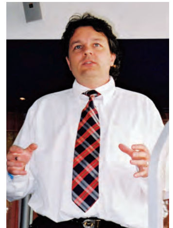
Mit Überzeugung werden die Ideen verkauft.