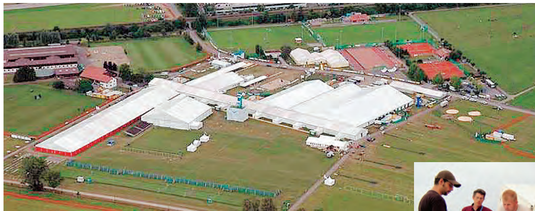
Die Zeltstadt mit ca. 22 000 m 2 Zeltfläche aus der Vogelperspektive.

Vom 2. bis 10. Juli 2005 fand in Wiesendangen das Kantonaltturnfest mit über 9500 Turnerinnen und Turnern statt. Die Schibli AG war im Auf- und Abbau der elektrischen Infrastrukturen und Verkabelungen aktiv und beteiligte sich mit einem Sponsoring von Fr. 20 000.–. Durch dieses waren wir somit massgeblich an den rund 52 000 Helferstunden beteiligt, die es brauchte, um diesen grossen Anlass auf die Beine zu stellen.