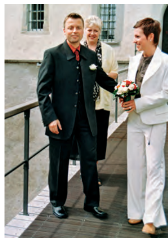
Auf der Zugbrücke zum Schloss Greifensee am 25. April 2003 mit unserer Standesbeamtin.

Nur stetige Entwicklung und solides Wachstum sichern die Zukunft. Um eigene Erfahrung mit Entwicklung Wachstum zu sammeln, experimentiere ich vorerst im Kleinen mit der Familie.