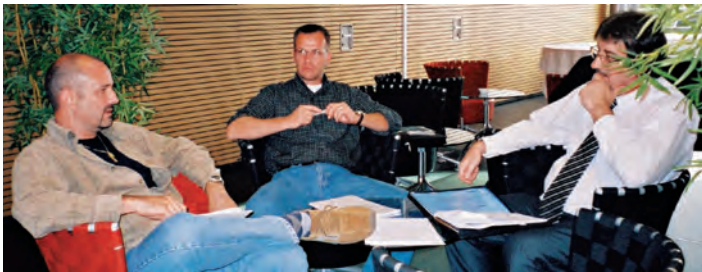
Gemeinsam werden Strategien entwickelt.